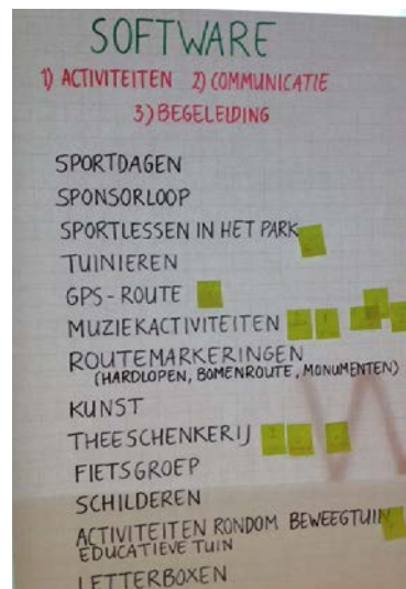
Prioritering activiteiten (software), juni 2015