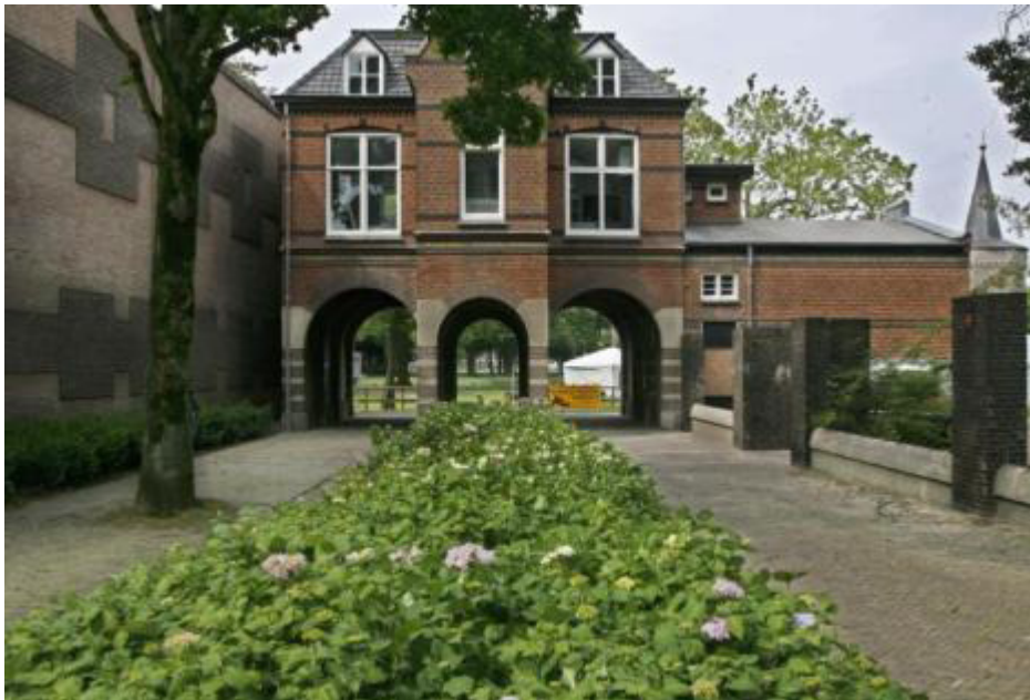
Figuur 4: Poortgebouw Berlaer van het kasteel te Helmond

Schoolgebouwen De gemeente heeft twee schoolgebouwen in haar beheer. Dit zijn BS de Vuurvogel en OBS Brandenvoort. De Vuurvogel en Brandenvoort zijn zogenaamde brede scholen. Overige gebouwen / terreinen De gemeente heeft naast accommodaties ook andere bouwwerken en terreinen in beheer. Te denken valt aan fietsenstallingen, parkeergarages, overslagterreinen en terreinen rond gebouwen. Een aantal hiervan worden verhuurd zoals de parkeergarages en fietsenstalling. Niet maatschappelijke ruimten Dit zijn een negental ruimten die verhuurd worden aan commerciële partijen. Waaronder een tweetal woningen en een Poortgebouw. Het Poortgebouw is onderdeel van het kasteel en heeft pasgeleden een horecabestemming gekregen. Bij de verhuur van een dergelijk horecagebouw stelt de gemeente vaak extra regels met betrekking tot de openingstijden en geluidsproductie.