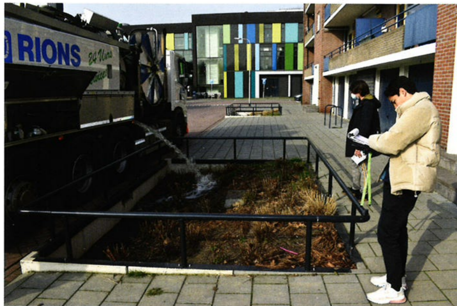
Full scale-testen bij diverse raingardens aangelegd op de Azuurweg. (Bron: www.climatescan.nl/projects/5200/detail)

Veel gemeenten en waterschappen willen weten of hun klimaatadaptieve maatregelen op lange termijn nog voldoende regenwater bergen en infiltreren. Onderzoek in Tilburg leert dat de infiltratiecapaciteiten van groenblauwe maatregelen sterk verschillen in ruimte en tijd, maar voldoende zijn om het water binnen enkele uren te verwerken. Bij goed ontwerp, aanleg en beheer kunnen deze regenwatervoorzieningen een kosteneffectieve bijdrage leveren aan het vasthouden, bergen en afvoeren van regenwater in het stedelijk gebied.