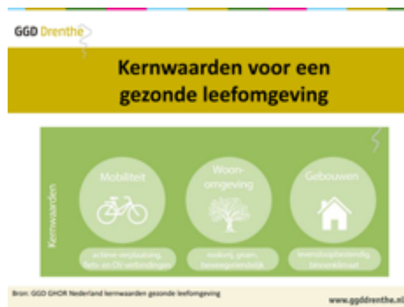
Figuur 1: kernwaarden voor een gezonde leefomgeving (GGD Drenthe)