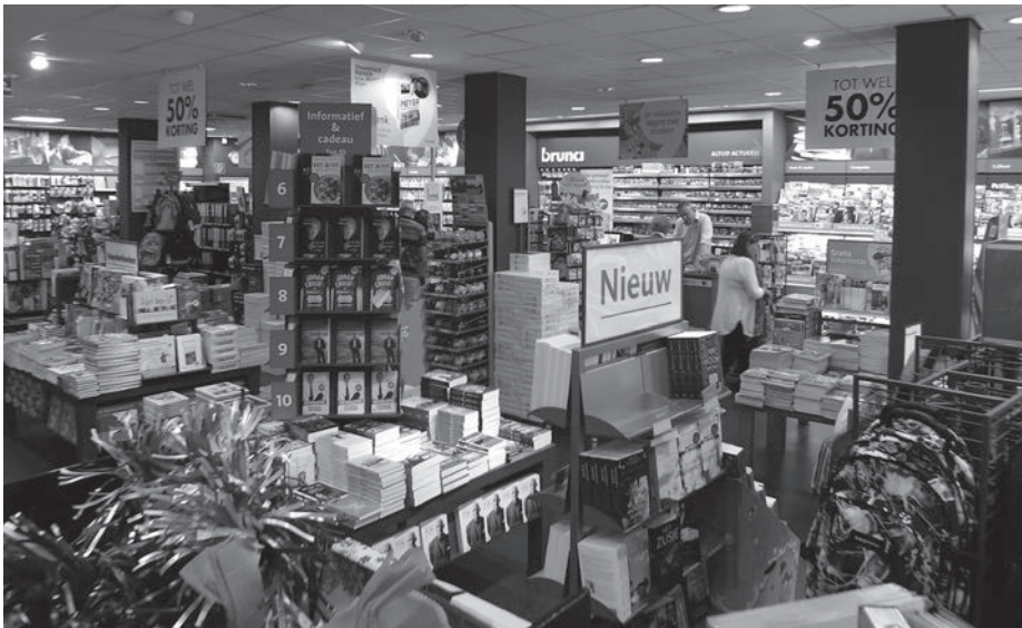
Figuur 8. Interieur van Bruna te Haren.

Het voordeel voor franchisenemers is dat ze de volledige marge ontvangen als een boek in de winkel wordt afgehaald, terwijl ze er relatief weinig werk aan hebben. Het genereert ook extra traffic. Ik realiseer mij dat niet iedereen blij is met de opmars van verkoop via websites. Maar het is niet meer weg te denken. Juist de combinatie van bestellen via internet en het fysiek afhalen met een persoonlijke klantbediening is een belangrijk pluspunt.'