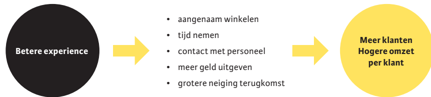
Figuur 1. Doelen van de retailer.

merk. Een voorbeeld is Apple: dit merk presenteert zich als het toppunt van innovatie, dus is het logisch dat de Apple Store in New York ook een zeer innovatief en doordacht interieur heeft.