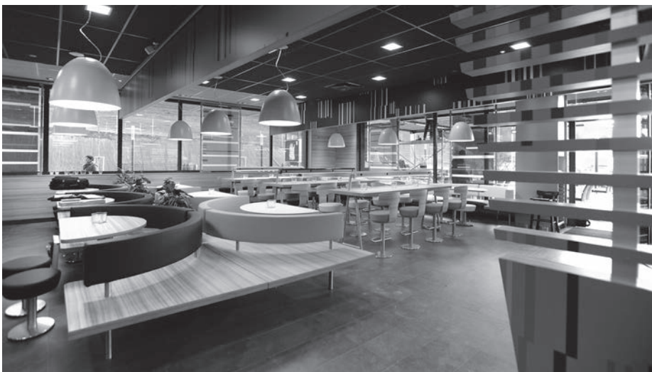
Figuur 2. Vernieuwd interieur van McDonald's.

Muziek kan ook een sfeerbepaler zijn. De gekozen muziek moet uiteraard bij de doelgroep passen. Retailers kunnen verschillende geuren in verschillende ruimtes gebruiken en de geuren ook laten afhangen van het seizoen (Spangenberg e.a., 1996).