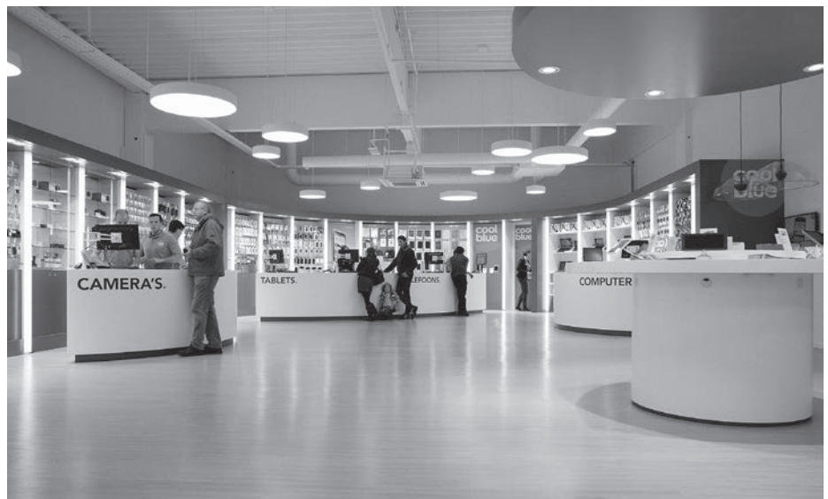
Figuur 3. Interieur van een Coolblue-shop.

Zowel in het model van Verhoef e.a. (2009) als in dat van Levy e.a. (2014) is de link met retaildoelen niet direct zichtbaar en daarmee dus ook niet op welke wijze de retailinstrumenten kunnen worden gebruikt. Om die reden is het wenselijk om beide modellen te combineren met het model van Alsem (2017) en dat van Alsem en Kostelijk (2016), waarin onderscheid wordt gemaakt tussen marketing als strategie (doelgroepkeuze en positionering) en marketing als tactiek (de vier P's plus een vijfde P, die van personeel). Zij stellen dat veel ondernemingen in de dagelijkse praktijk te zelden bewust stilstaan bij de strategische keuze van de positionering en zich te vaak en soms te ad hoc bezighouden met de tactische invulling van de marktinstrumenten. Richtlijnen bij het kiezen van een positionering ('merkwetten') is dat die gefocust ofwel scherp moet zijn, onderscheidend en relevant voor de doelgroep en consistent moet worden uitgedragen.