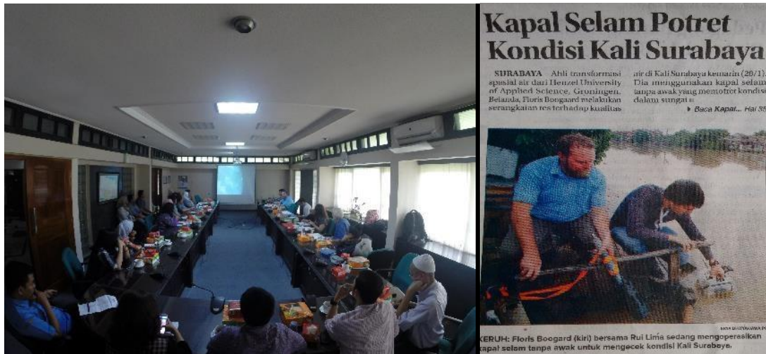
Afbeelding 5. Bespreking meetresultaten bij Jasa Tirta1 en kort verslag van metingen in Indonesische media

De meeste meetresultaten waren in het veld direct beschikbaar en werden on site besproken met alle partners. Zo nam men aan dat drijvende visvijvers door het overmatig gebruik van visvoer verantwoordelijk waren voor hoge nutriënt- en lage zuurstofgehalten. Uit metingen bleek dat de kwaliteit echter niet veel afweek van die op andere locaties (zowel aan de oppervlakte tot op diepten van 35 meter, gemeten met de drone). Wel zijn er duidelijke indicaties dat de waterbodem vervuild is door accumulatie van verontreinigingen. Geadviseerd is om naast de waterkwaliteit ook metingen aan de slibbodem te verrichten. Ook is inzicht in het gedrag van verontreinigingen van belang voor het ontwerpen van eventuele zuiverende voorzieningen.