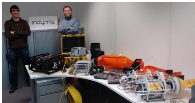
Afbeelding 1. De 'vloot' onderwaterdrones toegepast voor diverse onderzoeksdoeleinden.

De drones worden met name gebruikt voor monitoring van de waterkwaliteit, maar ook steeds meer voor andere doeleinden, zoals weergegeven in tabel 1.