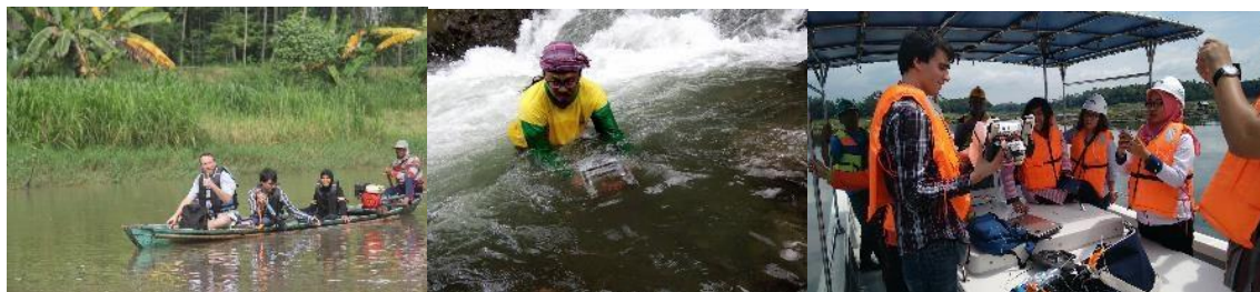
Afbeelding 3a. Sensoren op vissersboot. B. Onderwaterdrone in bovenstrooms schoon turbulent water. C. uitleg waterkwaliteitsmetingen in stuwdam