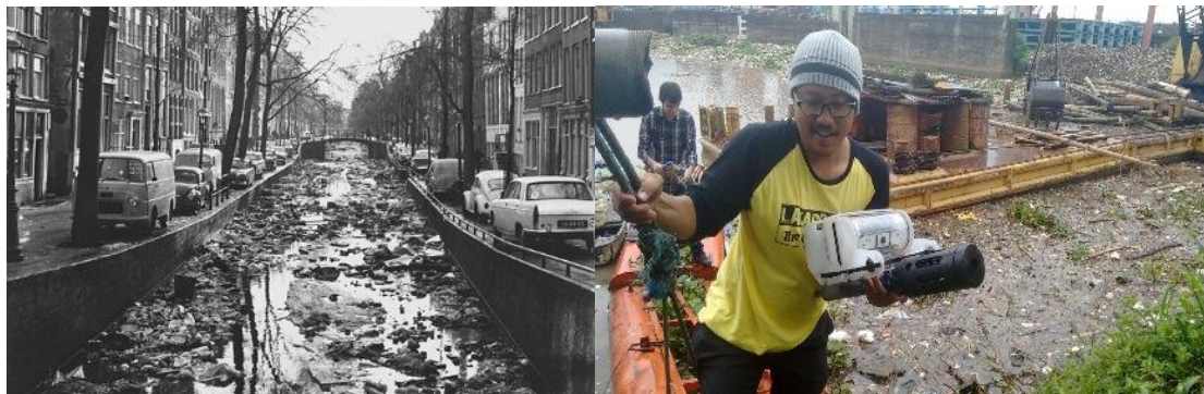
Afbeelding 2a. Vervuilde grachten in Nederland, rond 1970; afbeelding 2b. Vervuilde wateren in Indonesië waarbij onderwaterdrones zijn ingezet

De waterkwaliteit in veel Aziatische landen - zoals Indonesië - staat erg onder druk vanwege slecht vastafvalbeheer, hoge bevolkingsgroei en het ontbreken van afvalwaterinzamelings- en zuiveringssystemen voor huishoudens en industrie (zie afbeelding 2b). Decennia geleden was dit ook de situatie in Europa met zuurstofloze rivieren en Nederlandse grachten die gebruikt werden om huishoudelijk afval in te dumpen (zie afbeelding 2a). Het heeft ons tientallen jaren gekost om de kwaliteit van ons oppervlaktewater te verbeteren, maar het is ons gelukt dankzij aanpassing en uitbreiding van regelgeving, aanleg van voorzieningen zoals riolering en maatschappelijke bewustwording. Deze 'lessons learned' zijn van groot belang bij internationale kennisuitwisseling van de Nederlandse topsector water, een van de belangrijkste exportproducten van Nederland. Een eerste stap hierin is het onderzoeken van de huidige 'referentiesituatie' in Indonesië en het bepalen van de ambitie en strategie met de diverse stakeholders. Hierbij is samenwerking met diverse multifunctionele internationale organisaties van groot belang.