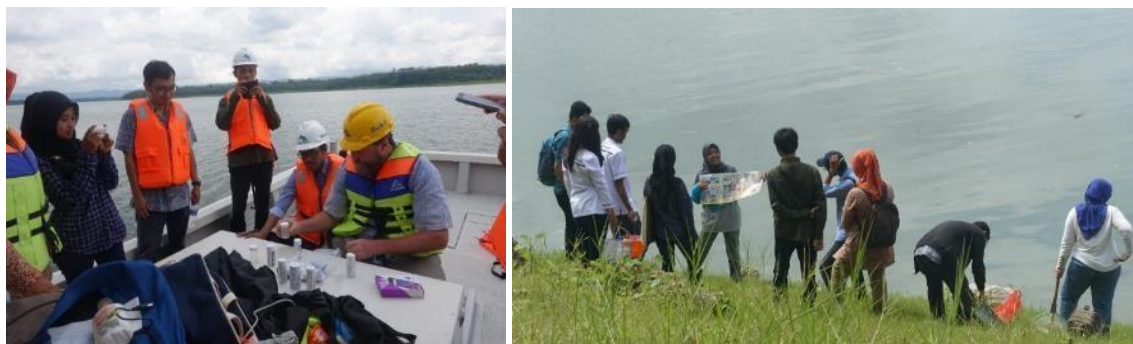
Afbeelding 4a. Uitleg waterkwaliteitsmetingen met teststrips en apps; 4b. Biomonitoring door ECOTON.