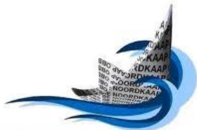
obs DE NOORDKAAP