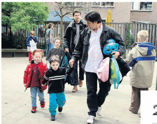
▲ Ouders worden steeds mondiger en maken het daarmee de kracht soms knap lastig.

Op andere, minder gekleurde scholen met kinderen van hoogopgeleide Nederlandse ouders, voelen docenten vaak een heel andere druk. „Daar krijgen ze te maken met extreem kritische ouders die denken