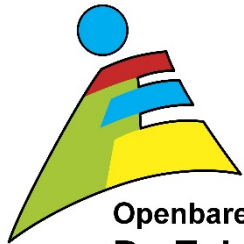
Openbare daltonschool De Eskampen