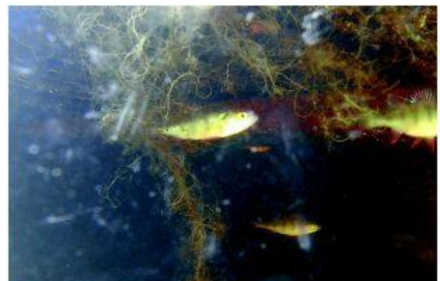
Onderwaterleven onder drijvende constructies zoals mossels (Schiedam) en vissen (Lelystad).