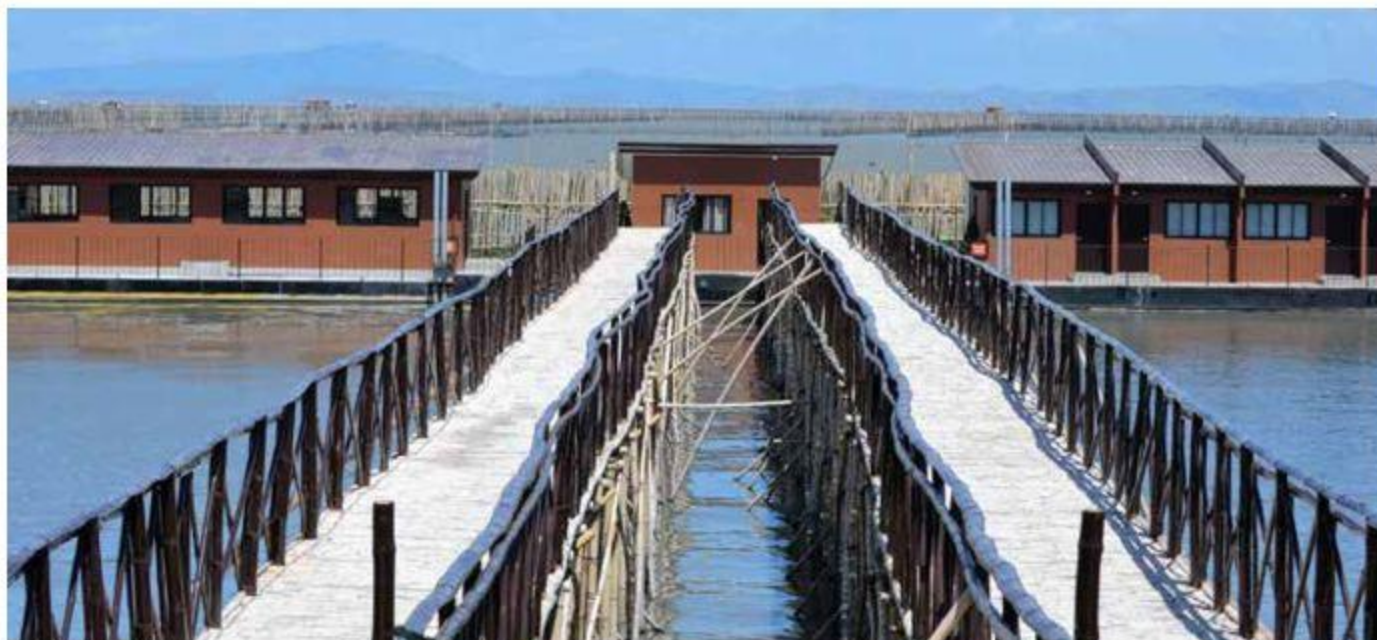
Eerste drijvende woningen in Manila Bay.

Een grootschalig opgezet onderzoek, waaraan Nederland deelneemt, laat zien dat de ecosystemen onder drijvende objecten nauwelijks worden benadeeld door bijvoorbeeld de beperkte lichttoetreding. Vervolgonderzoek richt zich op het leggen van verbanden tussen de ecoscans en waterkwaliteitsmetingen en de dimensies en bouwmaterialen van de constructies.