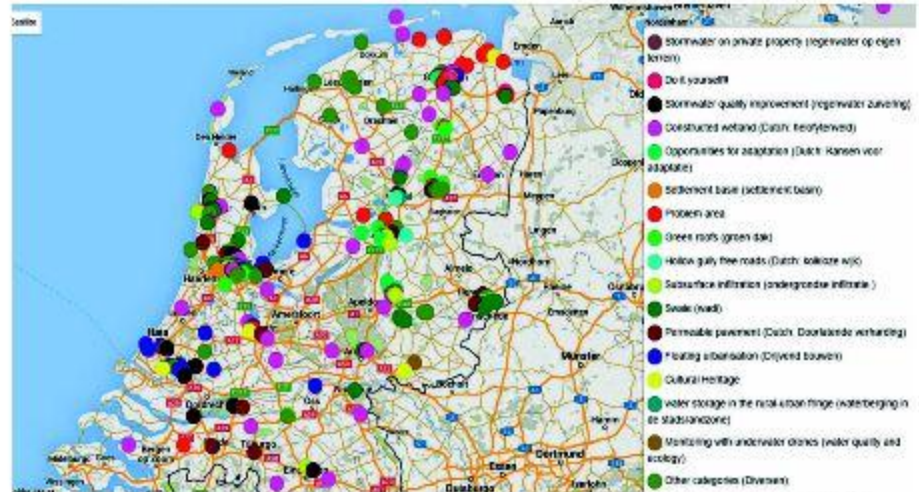
Inventarisatie van drijvende woningen in Nederland (blauwe stippen) in Nederland.

Bij het afdekken van een deel van het wateroppervlak kan onder de objecten een ongunstigere zuurstofhuishouding optreden. Beperkte